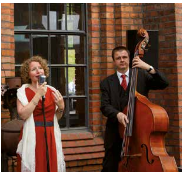
Musikalische Untermalung am Abend