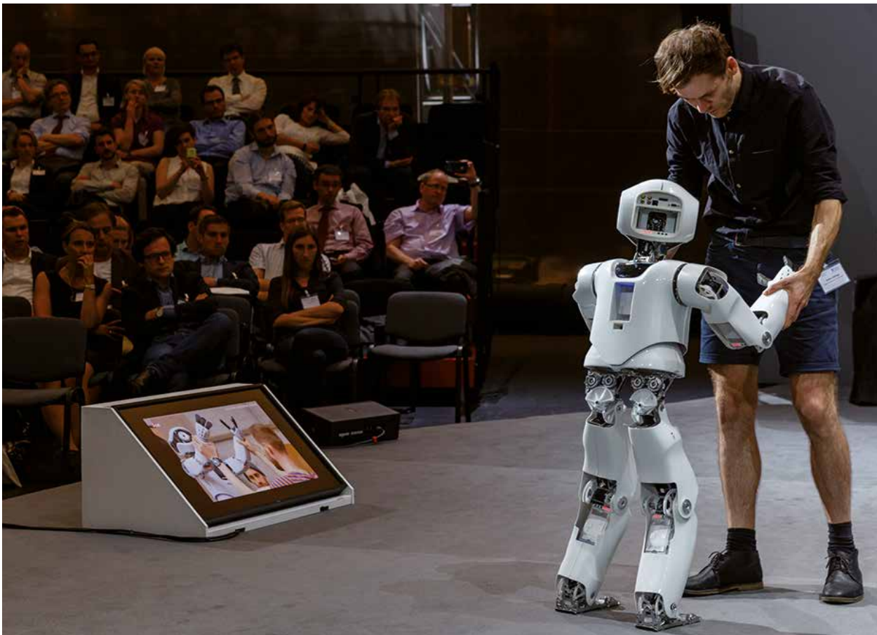
Mensch-Technik-Interaktion live: Opernroboter „Myon“ hat das Laufen gelernt.