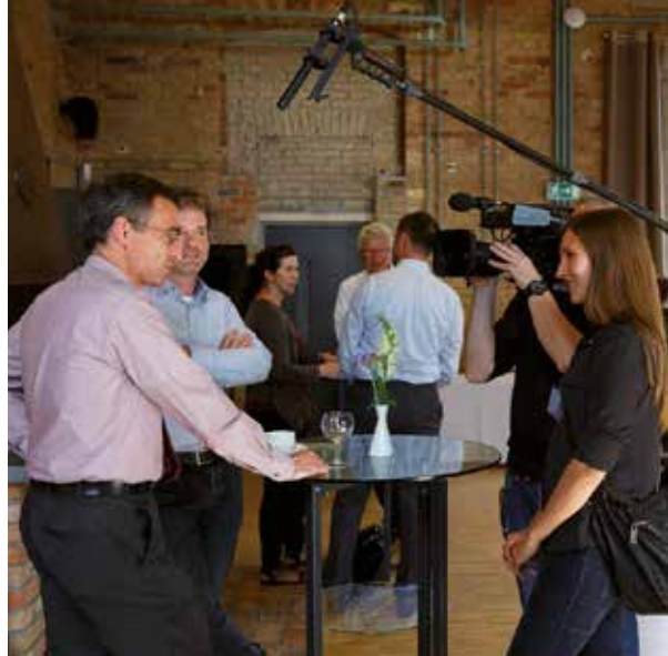
Ein Filmteam dokumentierte den 2. BMBF-Zukunftskongress Demografie.