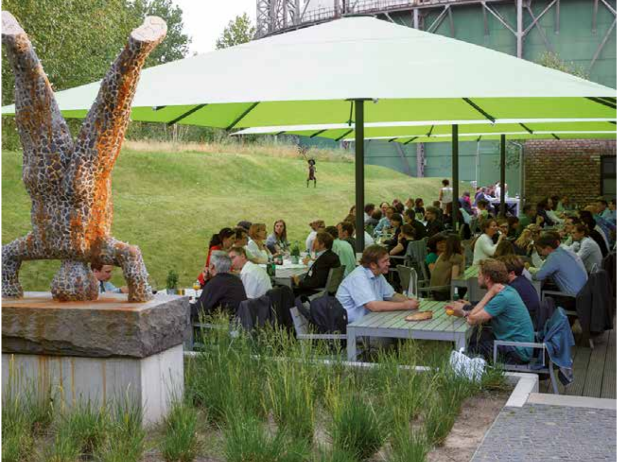
Die Pausen verbrachten viele Gäste auf der Terasse.