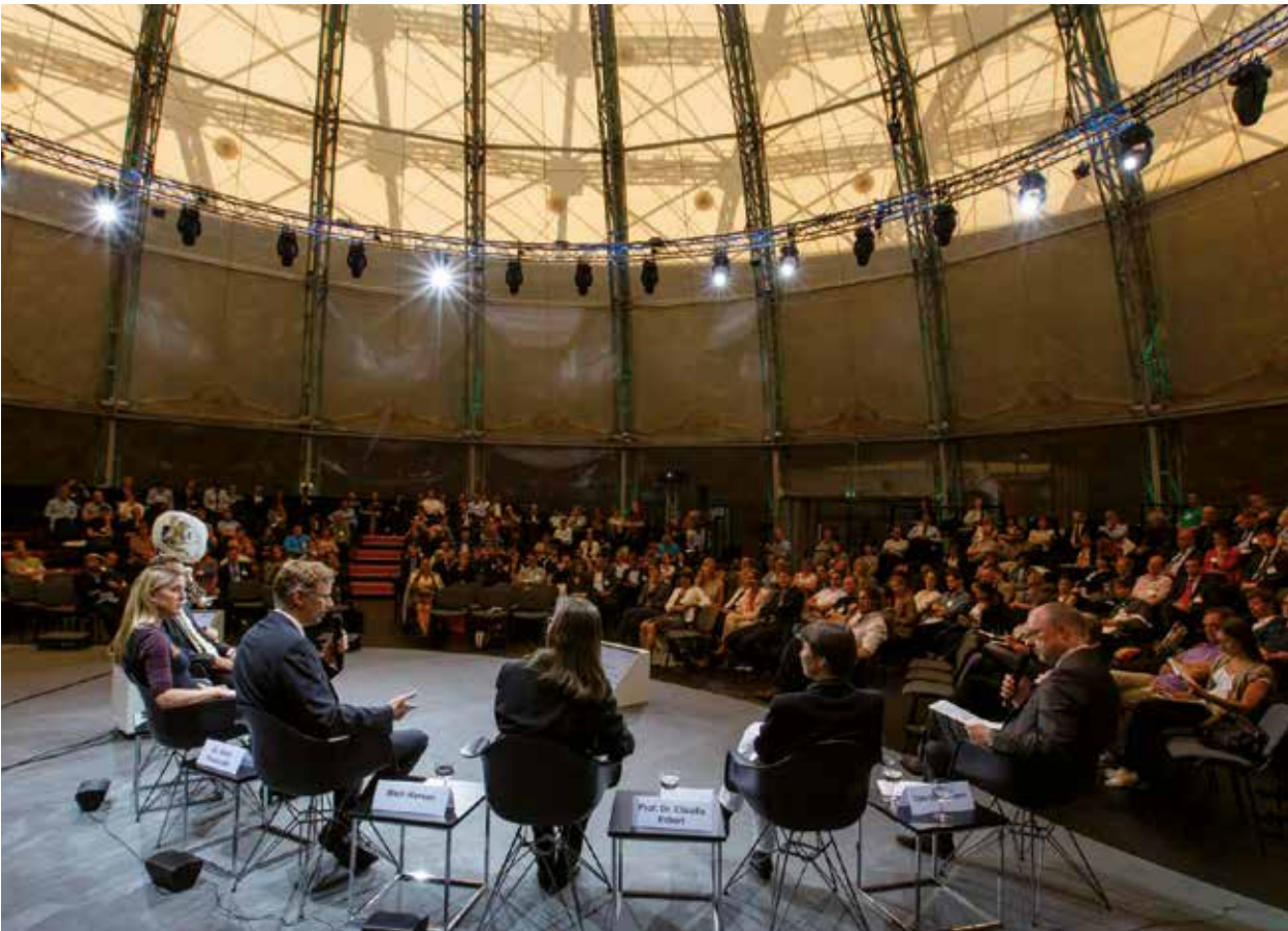
Rund 360 Gäste besuchten den 2. BMBF-Zukunftskongress Demografie im Gasometer in Berlin-Schöneberg.