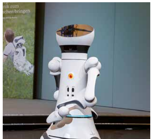
Der design-prämierte „Care-O-Bot 4“